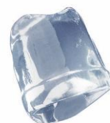
18 gr FULL ICE CUBE