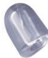
17 gr HOLLOW ICE CUBE